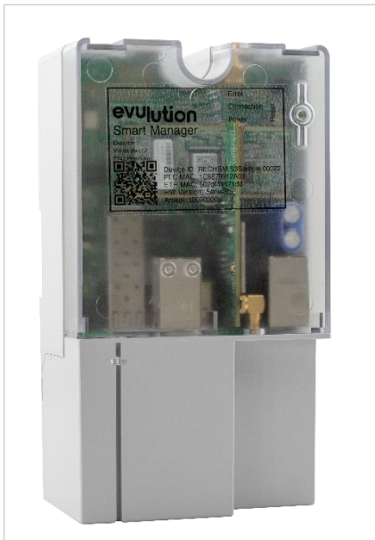
SMARTPOWER der EVUlation AG